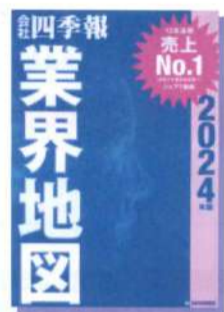
会社四季報業界地図 2024年版