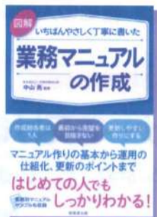
図解いちばんやさしく丁寧に書いた業務マニュアルの作成