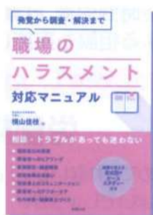
職場のハラスメント対応マニュアル： 発覚から調査・解決まで