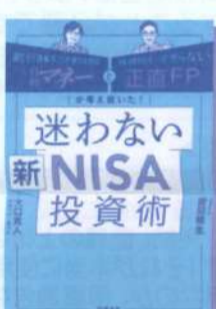
迷わない新NISA投資術： 日経マネーと正直FPが考え抜いた!