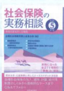
社会保険の実務相談 令和5年度