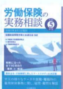
労働保険の実務相談 令和5年度