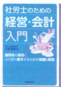
社労士のための経営・会計入門： 顧客先の経営により深く関与するための知識&実践