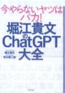
堀江貴文のChatGPT大全： 今やらないヤツはバカ!