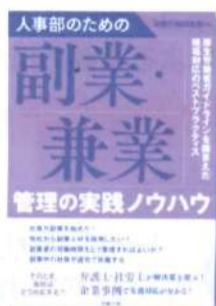
人事のための副業・兼業管理の実践ノウハウ： 厚生労働省ガイドラインを踏まえた現場対応のベストプラクティス