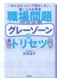
職場問題グレーゾーンの トリセツ 「知らなかった」で損をしない、 働く人の必携書