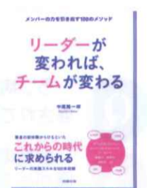
リーダーが変われば、 チームが変わる メンバーの力を引き出す 100のメソッド