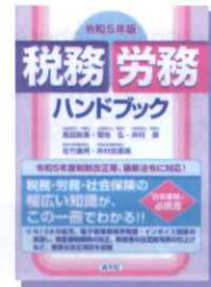
税務・労務 ハンドブック 令和5年版

産業労働情報コーナーでは、雇用、労働、就活等の図書、DVD及び雑誌を取り揃え、貸出をしています。 《貸出は3点まで、雑誌は閲覧のみ》 ホームページから図書、DVD、雑誌の検索ができます。また、主な労働専門雑誌の記事のタイトルをデータベース化しており、検索して情報を探すことができます。