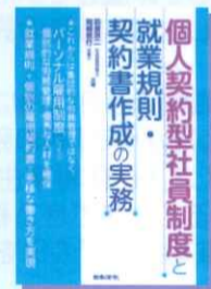
個人契約型社員制度と 就業規則・契約書作成 の実務