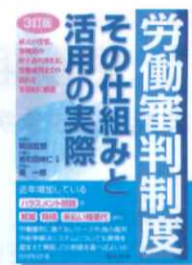
労働審判制度 その仕組みと活用実際 3訂版