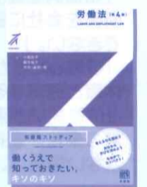
労働法 第4版 (有斐閣ストゥディア)