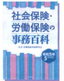
社会保険・労働保険の 事務百科 令和5年5月改訂