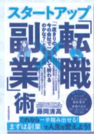
「一度きりの人生、今の会社で一生働いて終わるのかな?」と迷う人の スタートアップ 「転職×副業」術