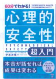
60分でわかる! 心理的安全性超入門